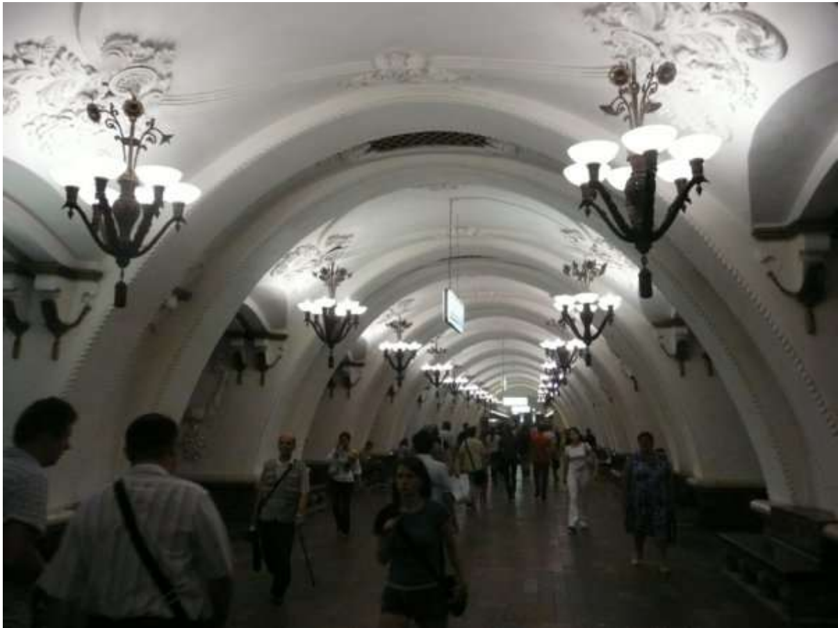
Stacja Moskiewskiego metra